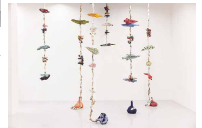
ミルナ・バーミア 《Sour Cords》2024