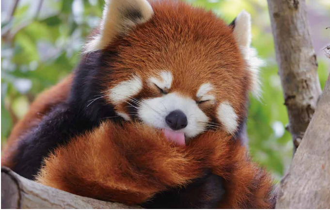
写真・文 池田 紅里 (がんセンター)

豊橋のんほいパークのレッサーパンダ「リーファちゃん」です。顔が可愛くしっぽもふわふわで、ファンの間では人気がある子です。休日は全国のレッサーパンダのところへ行き、写真を撮っています。