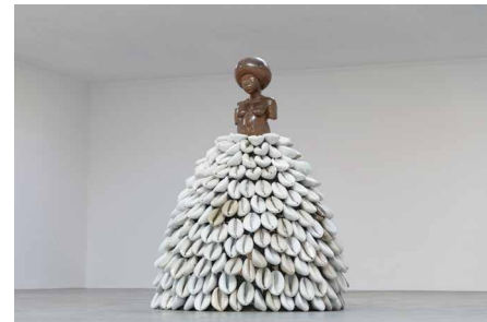
シモーヌ・リー (Untitled) 2023-24