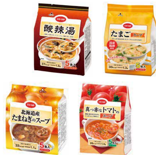
品番1スープセット 詳細は4Pをご覧ください。

東京海上日動火災保険株式会社(自動車保険、火災保険、ネット型生活保険の引受保険会社)等との共催により、組合員の関心の高いテーマについて「マネープランセミナー」を開催します。