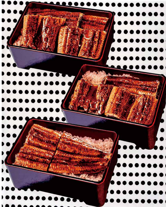
福田美蘭(松竹梅) 2017年 アクリルパネル 千葉市美術館蔵