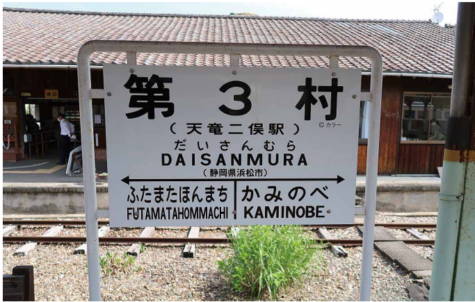
写真・文 山口 巖 (新城設楽農林水産事務所)

マツコの知らない世界「アニメ聖地巡礼の世界」で放送されたシン・エヴァンゲリオンの第3村のモデル地の一つとされる天竜二俣駅です。期間限定で第3村に駅名を改名していた時の写真です。