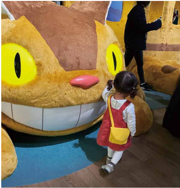
写真・文 今泉 絵里香 (教職員課)

ジブリパークに行った際、娘に「となりのトトロ」に出てくるメイちゃん風の服を着せて行きました。周りの方にも声を掛けていただき、本人も気に入っていたようでした。新しいエリアがオープンしたら、また別のコスプレで連れて行きたいです