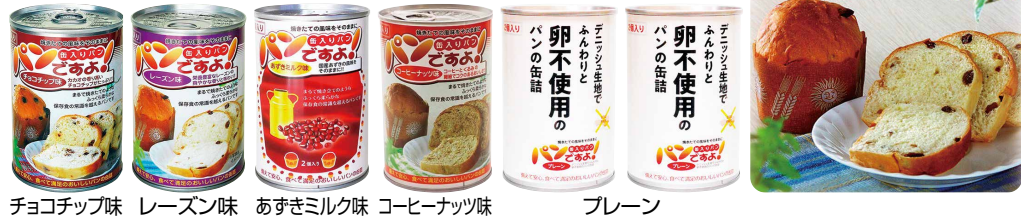
チョコチップ味 レーズン味 あずきミルク味 コーヒーナッツ味 プレーン

いつでも焼きたてのようにふっくら・柔らかなパン。 主食としてだけでなく、おやつとしてもどうぞ!