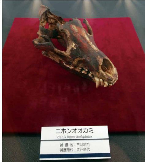
写真・文 原田 安一郎 (西三河農林水産事務所)