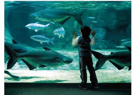
世界淡水魚園水族館 アクア・トトぎふ