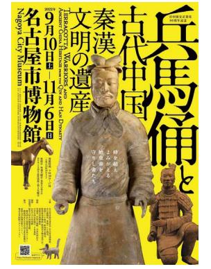
兵馬俑と古代中国