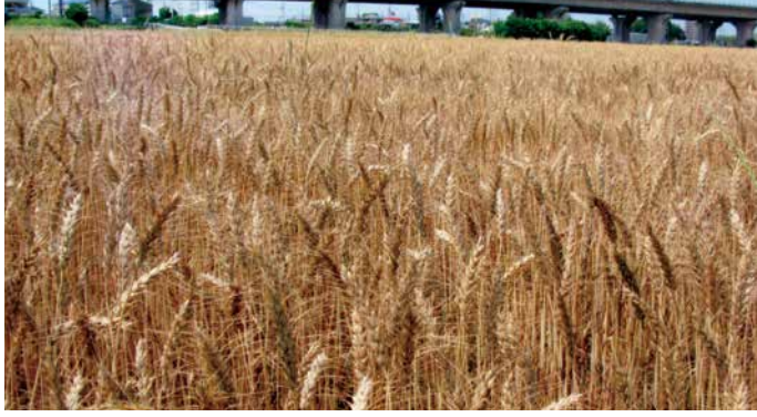
写真・文 原田 安一郎 (西三河農林水産事務所)

愛知県西三河地域は農業用水が不自由だった昔から麦の栽培が行われて来ました。収穫された小麦粉を原料にした製パン、製麺業も盛んです。やがて、明治用水が通水すると、豊富な農業用水を利用した水稻栽培が主要作物となり、麦は転作作物となりました。収穫前の黄金色の穂波を見ると、パンが食べたくなりますね。一日も早く用水が復旧し、事態が収束することを願っています。