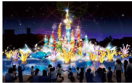
ラグーナ20周年アニバーサリーイベントゾクゾク!