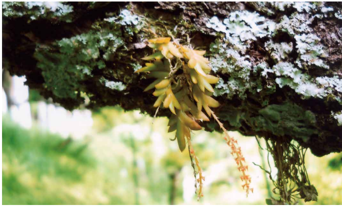
写真・文 原田 安一郎 (農地計画課)

家の裏の梅の幹にはヨウラクランがたくさん着生しています。ヨウラクランは日本固有のラン科の植物です。名前の由来は花房が垂れ下がる様をお寺の本堂や仏壇に下がる瓔珞(ようらく)になぞらえたものです。