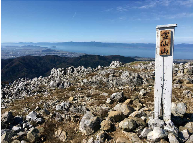
写真・文 今泉 絵里香 (教職員課)

先日、滋賀県米原市の霊仙山に登ってきました。1,094mの山で見晴らしがよく、琵琶湖が見渡せます。開けたところに出ると、白っぽいゴロゴロした石灰岩と枯れ木の風景が広がり、異国に来たかのような感じでした。