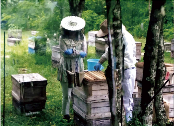
写真・文 宇野 和子 (西三河県税)

皆さんはハチミツの糖度をご存知ですか。私は80度以上と聞いてびっくりしました。この写真は今年7月中旬に南信州飯田市で貴重な採蜜体験をした時のもの。怖くて手が出ませんでした。