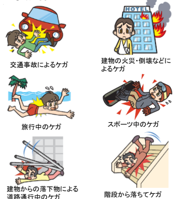
交通事故によるケガ 建物の火災・倒壊などによるケガ 旅行中のケガ スポーツ中のケガ 建物からの落下物による道路通行中のケガ 階段から落ちてケガ